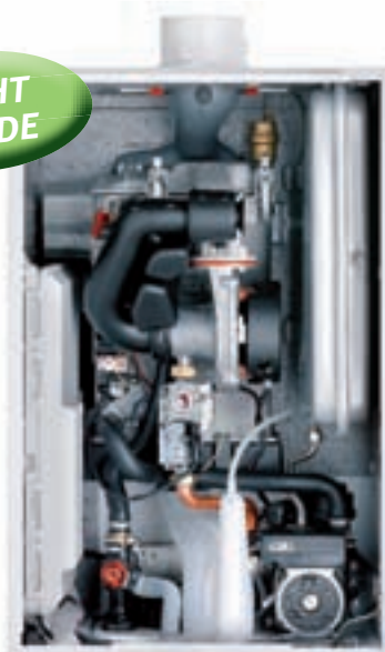
Innovens MCA 15