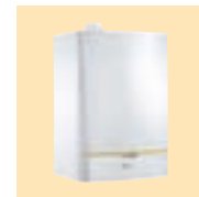
MCA 15 / 25 / 35 BS 130

Ketel H 690 mm B 450 mm D 450 mm 34 kg Boiler H 912 mm Ø 570 mm 63 kg