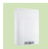
AWHP 11 tot 16 TR/MR

H 1350 mm B 950 mm D 417 mm 121 tot 135 kg